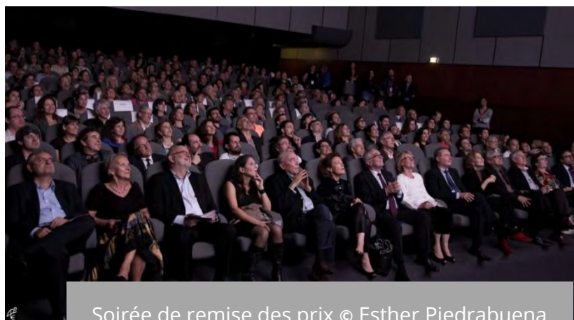
Soirée de remise des prix

Cinespaña est le rendez-vous incontournable de la rentrée toulousaine et de la région Occitanie-Pyrénées/Méditerranée, qui permet chaque année de découvrir le cinéma espagnol avec une programmation riche et variée : une compétition de longs-métrages de fiction et de documentaires, un panorama des meilleures productions de l'année, les nouvelles tendances du cinéma espagnol, des cycles thématiques et des rétrospectives , une programmation jeune public ... L'ouverture du festival aura lieu le 6 octobre à l'occasion de la Journée Internationale du cinéma espagnol.