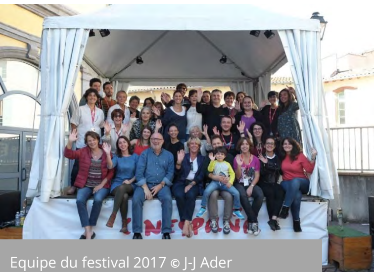
Equipe du festival 2017

Le festival cinespaña a été créé en 1996 et est organisé par l'association AFICH , l'Association du Festival International du Cinéma Hispanique qui compte une vingtaine de membres et œuvre pour la promotion et la diffusion du cinéma espagnol en France .