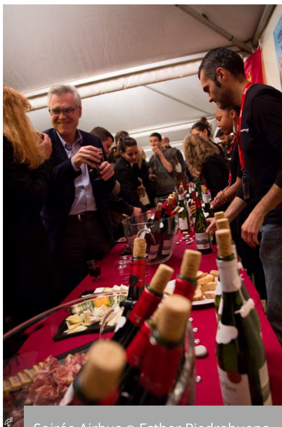
Soirée Airbus

Nous sommes à votre écoute pour mettre en place avec vous une soirée personnalisée.