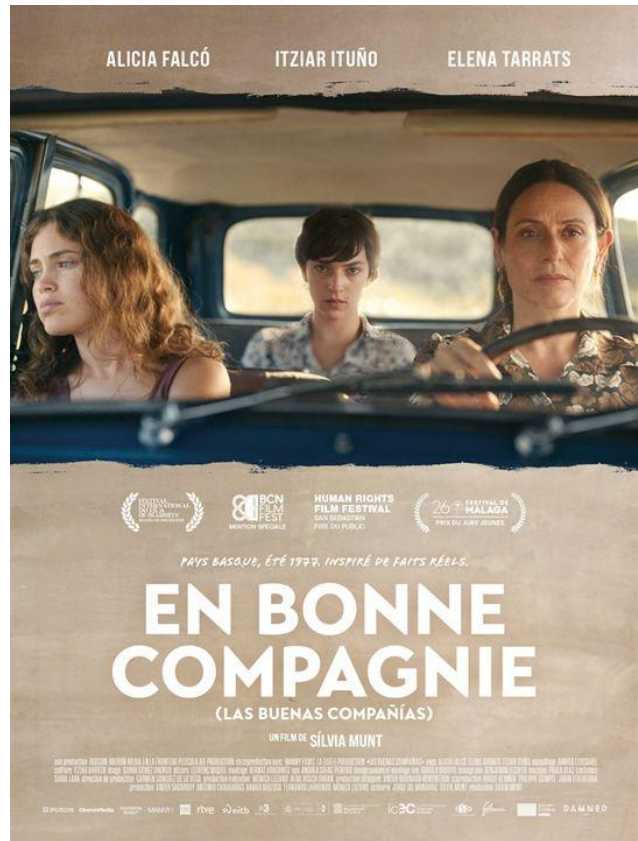
[cartel 1, cartel español]